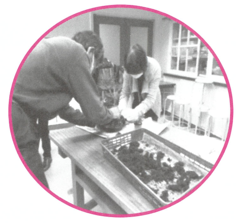
園芸講座 「盆栽制作」