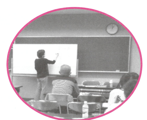
文芸講座 「源氏物語のヒロインたち」