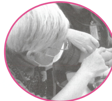
一般課程 「東洋医学と健康」